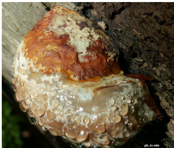
Fomitopsis pinicola 78 - St-Germain (Juillet 2009)