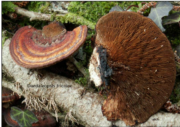
Daedaleopsis tricolor Lenzite tricolore

Ressemble à la Tramète rougissante mais au lieu de Pores, nous avons des Lames. Pousse sur divers Feuillus SIC