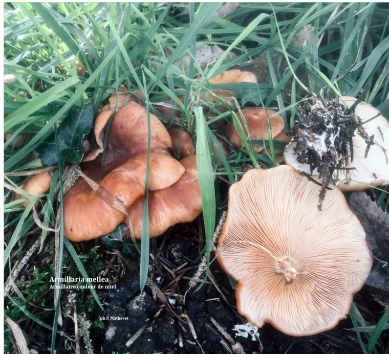
Armillaria mellea Amillaire couleur de miel

Voir fiche du 11 Déc 2021 À la Légion d'Honneur