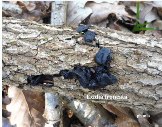
Exidia truncata Exidie tronquée

fructif arrondie-discoïdes fixée par un pied ±long Surface hyméniale noire à brun noire, mate & brillante face externe garnie de dents obtuses Chair gélatineuse Habitat : sur bois morts de Feuillus SIC