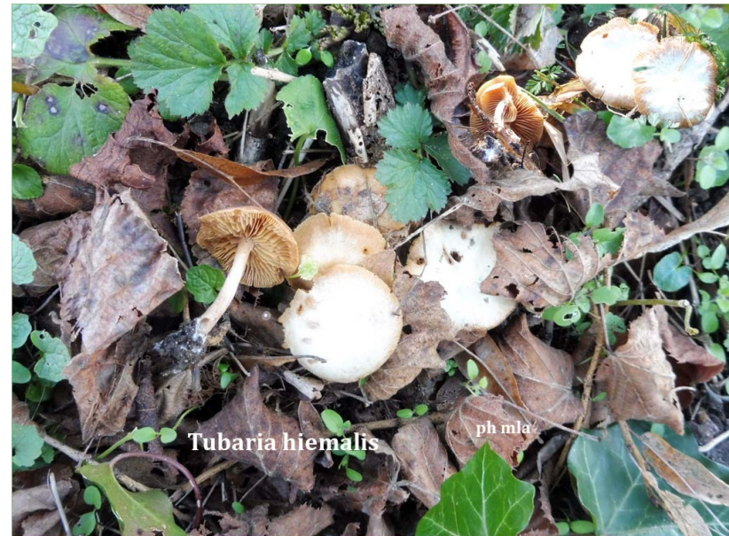
Tubaria hiemalis Tubaire hivernal

Voir fiche du 11 Déc 2021 À la Légion d'Honneur