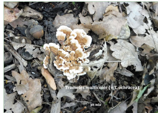
Tramète multicolore Ou Tramète ochracée