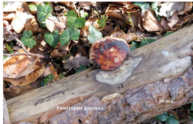
Polypore des Pins