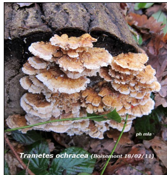
Trametes ochracea ou Trametes multicolor