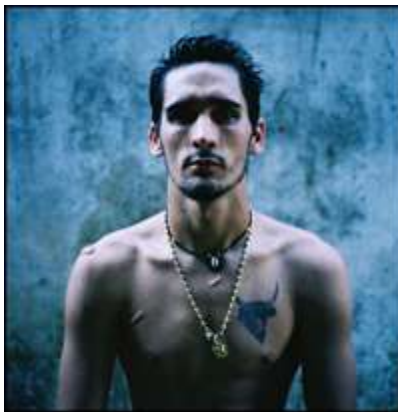
Carreau de Cergy jusqu'au 24 avril