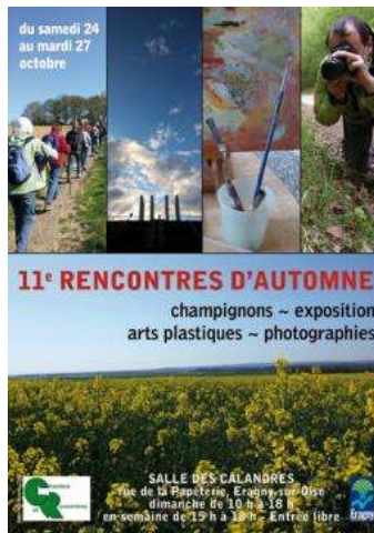
Exposition « Rencontres d'Automne »