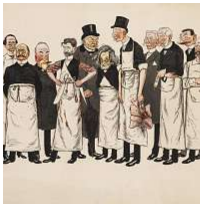
Musée des Arts décoratifs