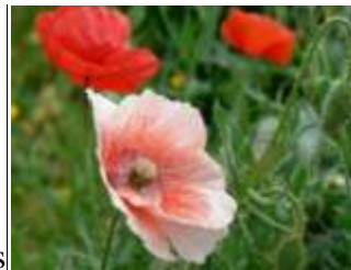
Fleurs de mon jardin ; un coquelicot albinos