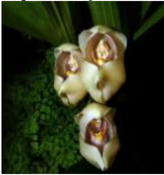
Bébés emmaillotés (Anguloa Uniflora)