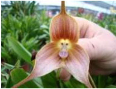
Fleur à tête de singe (dracula Simia)