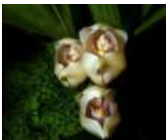
Bébés emmaillotés (Anguloa Uniflora)