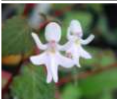
Les filles qui dansent (Impatiens Bequaertii)