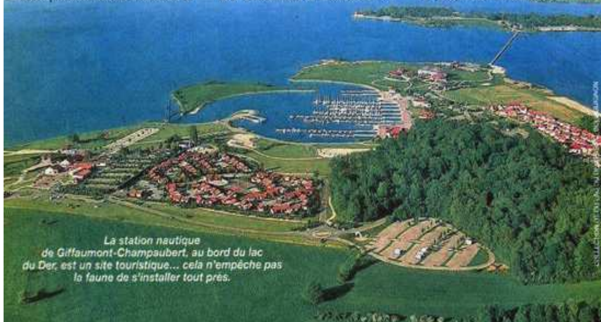
La station nautique de Giffaumont-Champaubert, au bord du lac du Der, est un site touristique... cela n'empêche pas la faune de s'installer tout près.

Le lac du Der est devenu un site important d'observation de la nature. De nombreux aménagements ont été réalisés, notamment des affûts pour étudier les oiseaux. Un large éventail d'animations est également proposé par l'office de tourisme, en collaboration