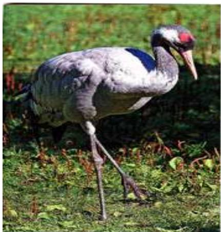
La grue cendrée est l'un des plus grands échassiers d'Europe.

espèces d'oiseaux, notamment des migrateurs dont la route survole la Champagne.