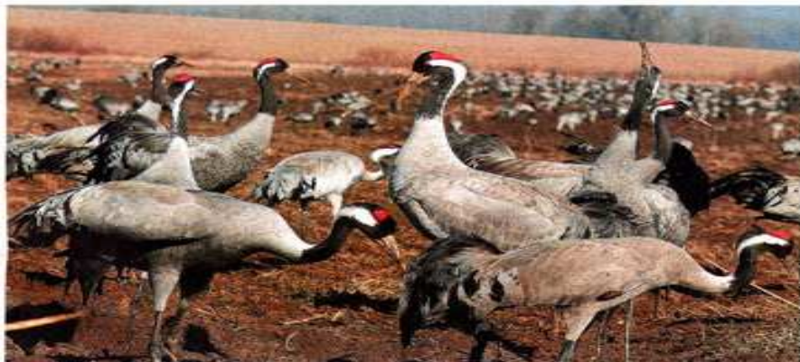
▲ Les grues trouvent toujours de la nourriture dans les champs alentour.

En vol, on reconnaît les grues car elles progressent avec les pattes et le cou tendus. Elles forment de longs V, repérables de loin et l'on peut parfois entendre leurs cris sonores « krou-krou » qui résonnent comme des klaxons, malgré l'altitude à laquelle elles