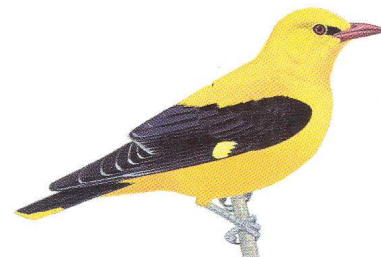
D'après les Guides du Naturaliste Delachaux et Niestlé